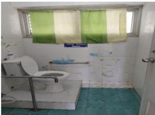
ห้องน้ำสำหรับคนพิการ