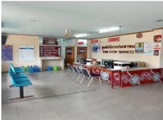
ที่นั่งรอสำหรับบริการประชาชน