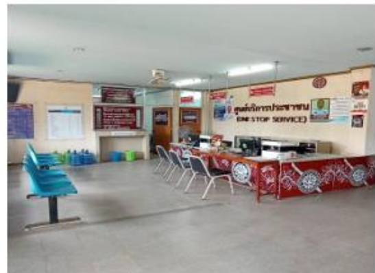
ทีวีสำหรับบริการประชาชน