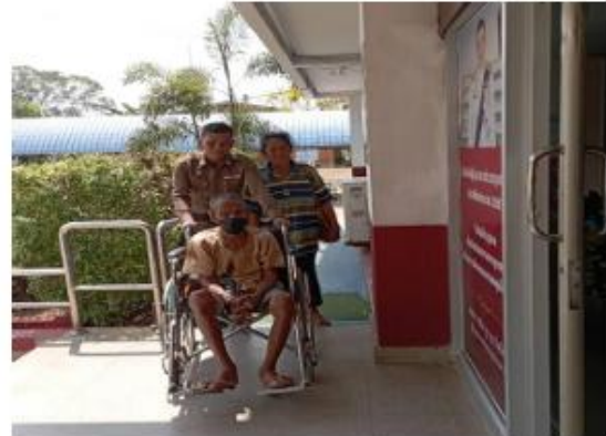
รถเข็นสำหรับคนพิการ