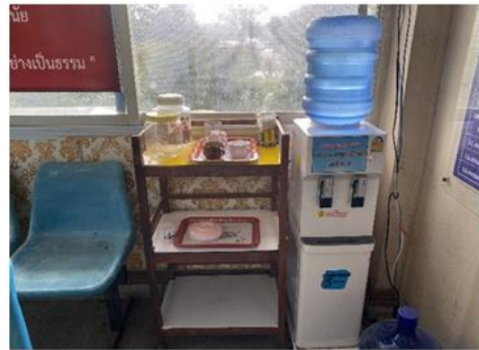
มีน้ำดื่มบริการประชาชน