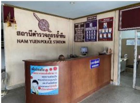
มีบัตรคิวสำหรับผู้มารับบริการ