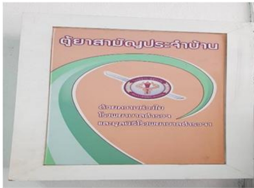
มีตู้ยาบริการประชาชน